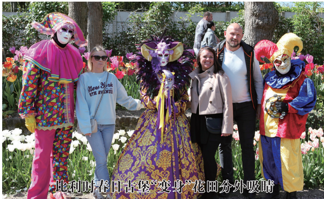
比利时春日古堡“变身”花园分外吸睛

随着物价持续上涨,越来越多的日本消费者预期通胀状态将继续。日本央行最新调查显示,受访消费者预期5年后的物价涨幅将比现在平均上涨10.3%,创下2006年该调查开始以来最高水平。